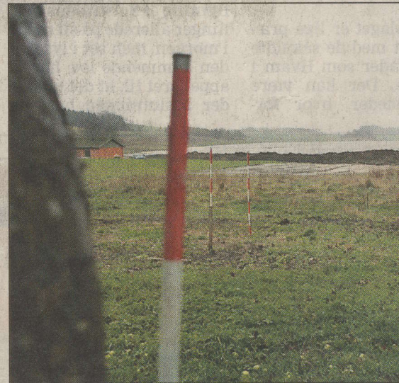
Fra konfirmandhuset får man denne udsigt