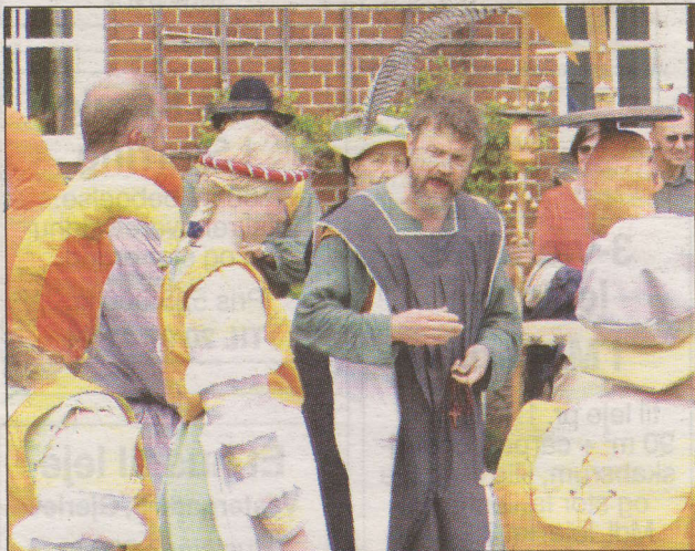
Kulturrøddernes Teatergruppe opførte deres reformatyionsspil ved Grundlovsfesten i Rødning