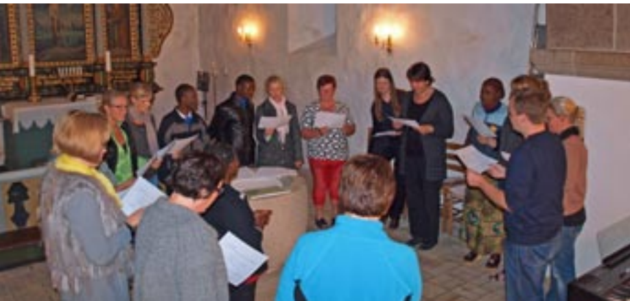
Sødal Happy Singers øver i Løvel kirke. Denne aften sammen med fire gæster fra Tanzania.

Sødal Happy Singers repertoire spænder vidt, fra gospel over rytmiske salmer til pop og viser. Ved koncerten i Løvel Kirke vil der også blive sunget et par jule- og vintersange, ligesom der bliver mulighed for publikum til selv at deltage i nogle fællessange. Alle er selvfølgelig velkomne i kirken – kom og vær med til at synge julen ind – i rigtig god tid.