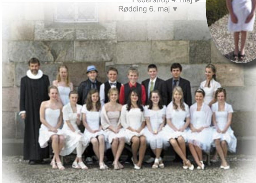
Billederne af Rødning- og Løvelholdene er taget af Fotograf-i v/Mette Kris