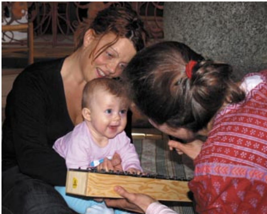
Babysalmesang i Rødning kirke Læs mere på side 2.