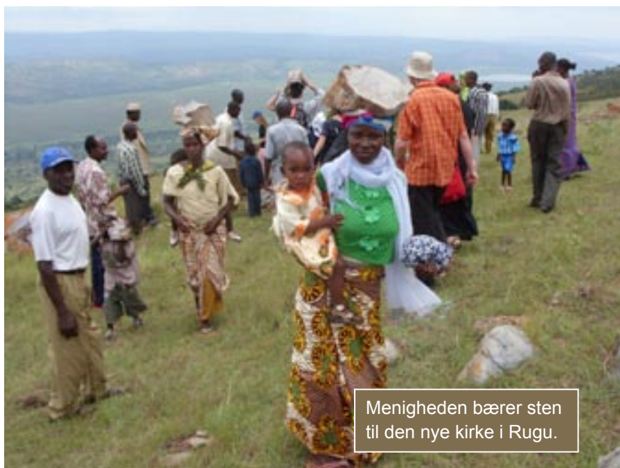
Menigheden bærer sten til den nye kirke i Rugu.

ubesværet gik med store kantede sten på hovedet. Præsten lagde sin alterbog under stenen, heller ikke han var længere vant til at bære de byrder, som kvinder og børn i landsbyen dagligt påtager sig at bære.