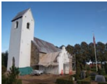
Nyt tag på våbenhuset.

Før var kirken opvarmet af et 50 år gammelt oliefyr på våbenhusets loft, som via nogle store blæsere under kirkens tag sendte varm luft ned gennem kirkeloftet. Menighedsrådet ønskede, at erstatte oliefyret med et gasfyr og fortsætte med luftopvarmning, idet dette både er en billigere og en miljømæssig god løsning. Men kirken er fredet i klasse A, så derfor skulle projektet godkendes af Nationalmuseet. Vi fik blankt afslag. Det gamle anlæg var aldrig godkendt, og Nationalmuseet kunne ikke acceptere de store installationer på