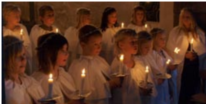
Fra sidste års Luciaoptog i Rødding kirke