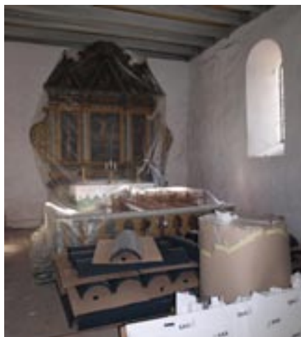
Al inventar pakket ind i plastik og pap.

På kapellet er der også lagt nyt tag, og toiletet er bygget om, så der nu også er adgang for kørestolsbrugere.