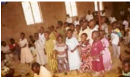
Søndagsskolekoret fra Rugabo - en af de 7 menigheder i Kasheshe sogn.

lang og masser af støv overalt. Til september kommer regnen – om Gud vil... Og så sender han med brevet billeder fra et korstævne som blev holdt 19. juli i Rugabo, en af de 7 menigheder i Kasheshe sogn. På korstævnet deltog en række kirkekor fra Kasheshes menigheder. Korene sang og konkurrerede om at blive bedst. Vinderkoret blev Zion-koret, et ungdomskor fra Rugabo og nummer 2 blev Tumaini fra Kasheshe, tumaini betyder håb. De 2 bedst placerede kor går nu videre til et korstævne for hele provstiet. Og derfra går vinderen videre til det store korstævne for hele Karagwe stift. Når vi får nyheder om korstævnerne og Kasheshe-korenes placering lægger vi det på hjemmesiden. På billedet er det Søndagsskolekoret fra Rugabo, der synger. Der er flere billeder fra korstævnet på hjemmesiden - www.roddingkirke.dk .