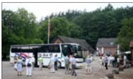
Ved Pøt Mølle.

på, tog dog udsynet til sidst. Både på ud- og hjemturen havde vi lejlighed til at synge sammen i det gode selskab, vi havde med hinanden. En god og oplevelsesrig tur!!!