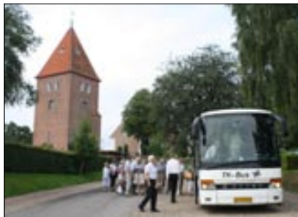
Gammel Ry kirke.