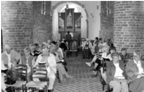
Salmesang i Thorsager Rundkirke

Første ophold gjorde vi ved Thorsager Kirke, der just har rundet de 800 år, og som, indtil Søndermarkskirken blev bygget, var Jyllands eneste rundkirke. Her fortalte organisten kort og godt om kirken og spillede til Du gav mig, o Herre på det meget nye orgel.