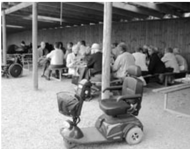
Kaffepause i dyreparken.