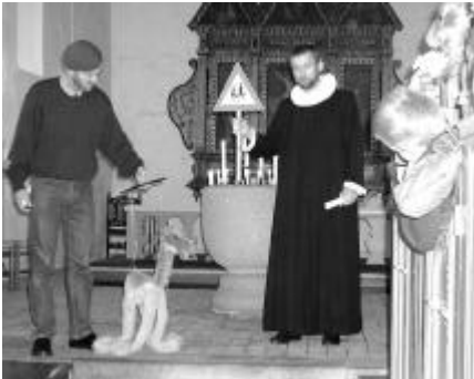
Fra sidste års børnegudstjeneste, hvor kirken fik besøg af Kalle Kamel, som ikke kunne finde vej til Betlehem.

Løvelbørnene får deres dåbsbibel ved børnegudstjenesten i Løvel kirke 14. december kl. 14.00. Efter gudstjenesten er der juletræsfest i forsamlingshuset.