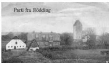
Rødding kirke og præstegård

Arbejdsgruppen efterlyser billeder, tegninger og genstande, som kan være med til at kaste lys over de hundrede år.