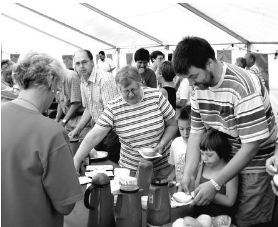
Efter teltgudstjenesten i Rødding var der trængsel omkring kaffebordet.