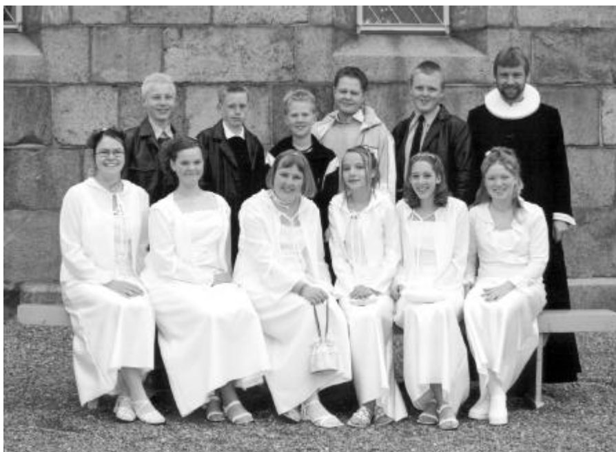
Løvel-holdet, konfirmeret 28. april 2002