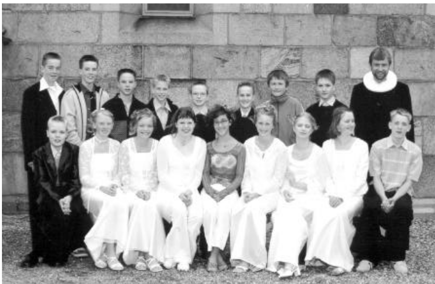
Rødding-holdet, konfirmeret 5. maj 2002