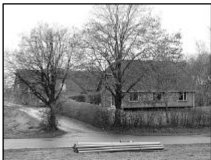
Forpagtergården på Vansøgårdsvej sælges ikke i denne omgang.

ejendommen til en pristalsreguleret pris, der aftales nu. Forpligtelsen gælder, hvis menighedsrådene ønsker at afhænde inden udgangen af år 2005. Modsat indrømmes kommunen forkøbsret til resten af forpagtergården, såfremt det kan ske på én gang.