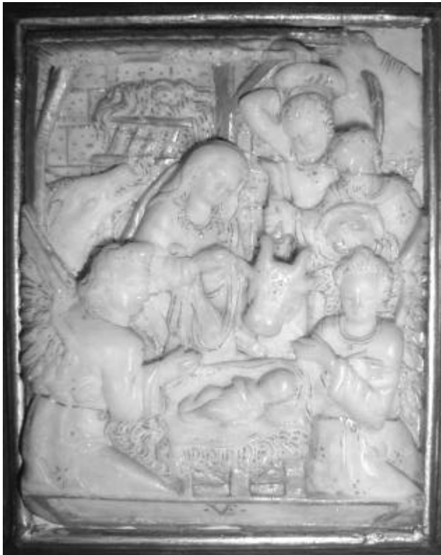
Julemotiv fra Rødning kirke, se side 2.