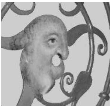
Skræmmemaske fra alterskranken i Rødding kirke. Tvinger blikket opad.

Tiltrækkemaskerne skal udtrykke skønhed. Typisk er det engleansigter. De er altid anbragt øverst oppe. Når et menneske ser op på alteret eller prædikestolen, er det altså meningen, at blikket skal frastødes af skræmmemaskerne og søge op imod tiltrækkemaskerne. På den måde tvinges øjnene opad og i samme bevægelse vendes det indre blik fra det jordiske til det himmelske.