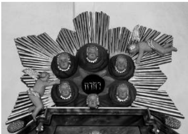
Toppen af altertavlen i Rødding kirke. Guds navn er omkranset af seks englemasker og en lysglorie.

Middelalderens bygninger og rum er ofte prydet med masker. Vi ser det også i kirkerne her i pastoratet. Især er der mange masker i Rødding kirke. Se bare på prædikestolen og alteret.